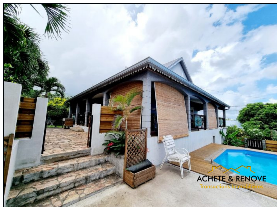
Achete&Rénove villa PLaine St Paul